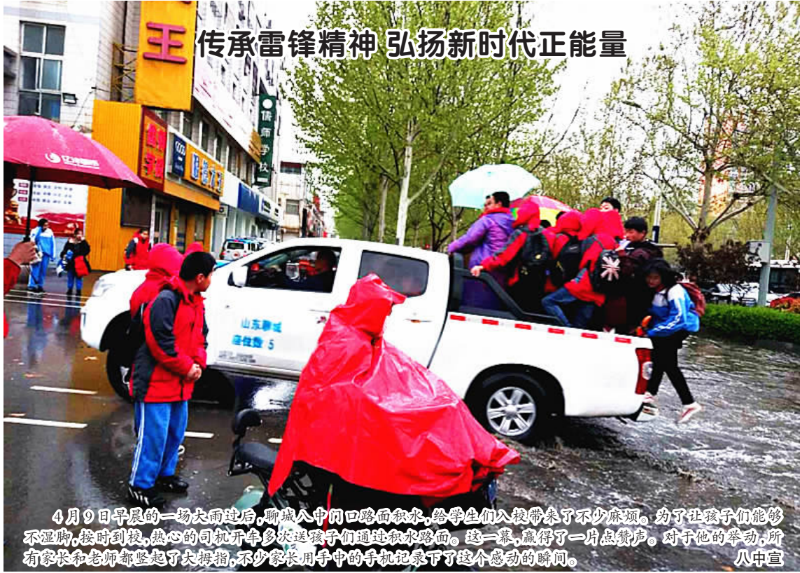
4月9日早晨的一场大雨过后，聊城八中门口路面积水，给学生们上校带来了不少麻烦。为了让孩子能够不湿脚，按时到校，热心的司机开车多次接送孩子们通过积水路面。这一幕，赢得了一片点赞声。对于他的举动，所有家长和老师们都竖起了大拇指，不少家长用手机记录下了这个感动的瞬间。