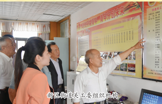
新区街道关工委组织机构