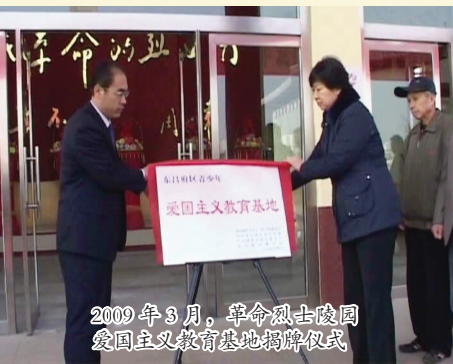
2009 年 3 月,革命烈士陵园爱国主义教育基地揭牌仪式

区关工委 2005 年、2010 年连续两次被评为全国关心下一代工作先进集体,1 次被评为全省关心下一代工作先进集体;古楼街道湖北社区关工委被评为全国“五好基层关工委”先进集体;新区街道、郑家镇、教育局、水务局、实验中学、湖北居民小区等基层关工委被评为省级先进集体。2 人被评为全国关心下一代工作先进个人,10 人被评为全省先进个人。